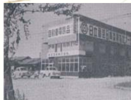
■1974(昭和49年)3月20日 青森電装株式会社設立(青森市長島)