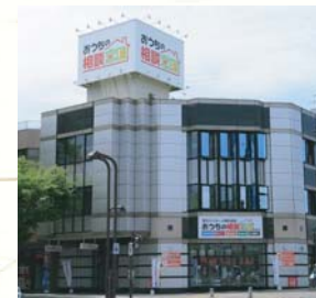
■2006(平成18年)6月1日 ボーダフォン柳町通、経営譲受