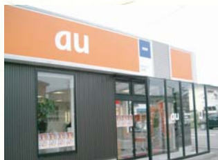
■2002(平成14年)9月20日 au弘前西開設