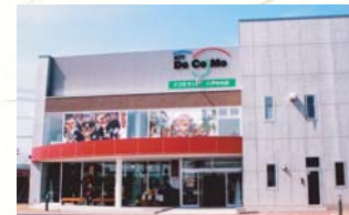
■2004(平成16年)9月14日 ドコモランド八戸中央店沼館へ 新築移転