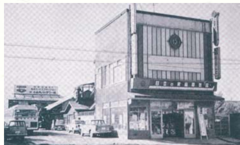
■1954(昭和29年) デンソー・サービス店「DN・SS」(全国24社)に認定