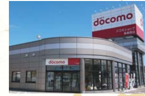
■2011(平成23年)2月18日 ドコモショップ五所川原店・移転新装