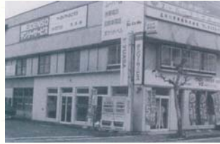
■1964(昭和39年)5月8日 五所川原電装設立

小山内バッテリー社は昭和25(1950)年4月・弘前市和徳字稲田(大町通り)で産声をあげました。以来、「クルマの電気屋」として、弘前市を拠点に業績を重ね、本年で創業66周年を迎えることができました。現在は、青森県内と秋田県大館市においてグループ全体で6社19拠点を数えるまでに成長し、青森県内はもとより秋田県北で電装・自動車・モバイル事業を展開しています。多くの社員の皆さんと地域のお客様に支えられてきた小山内バッテリー社——その66年間の歩みをたどってみました。