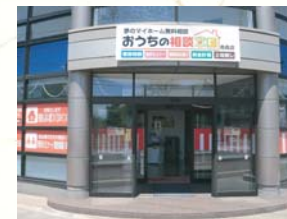
■2015(平成27年)4月1日 株式会社おうちの相談窓口青森設立 4月12日弘前店開設 5月17日青森店開設