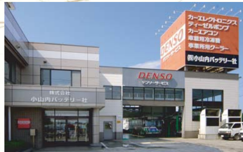
■2000(平成12年)1月24日 小山内バッテリー社青森店開設