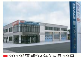
■2012(平成24年)5月12日 五所川原電装新築 ダイアグステーション開設