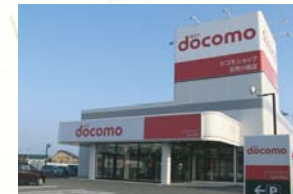
■2010(平成22年)11月18日 ドコモショップ青森西店 リニューアルオープン