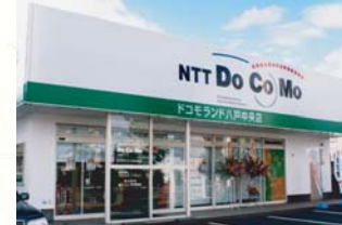
■2001(平成13年)10月13日 ドコモランド八戸中央店開設 ■2000(平成12年)12月12日 ドコモショップ五所川原店 新築移転