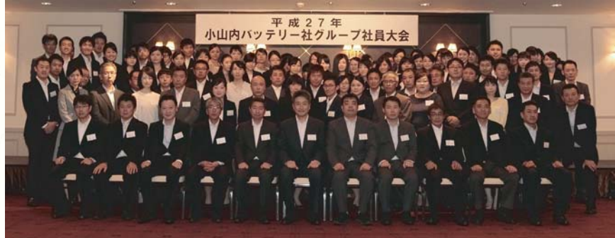
■2015(平成27年)9月10日 小山内バッテリー社グループ社員大会開催