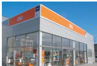
■2009(平成21年)2月20日 au大館樹海、移転