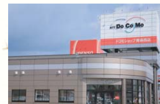
■1994(平成11年)12月24日 ドコモショップ青森西店開設