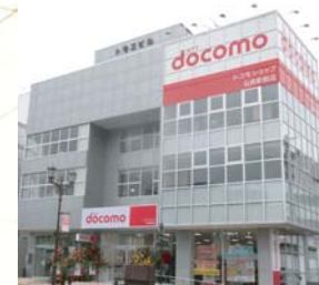
■2012(平成24年)11月22日 ドコモショップ弘前駅前店 増床リニューアルオープン