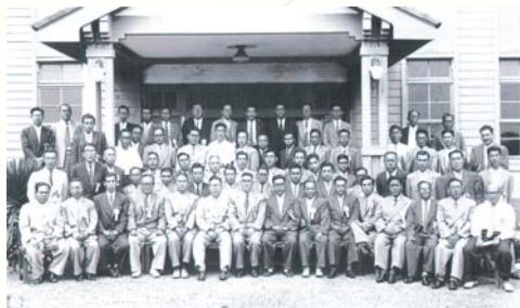
■1950(昭和25年) 弘前市大字和徳字稲田(大町通り)に創業 自動車電装品整備・販売を開始